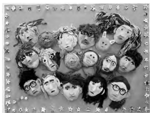
〈工芸〉社会福祉法人 愛宕福祉会 ドリームカレッジ 「私と私達は未来をつくる」