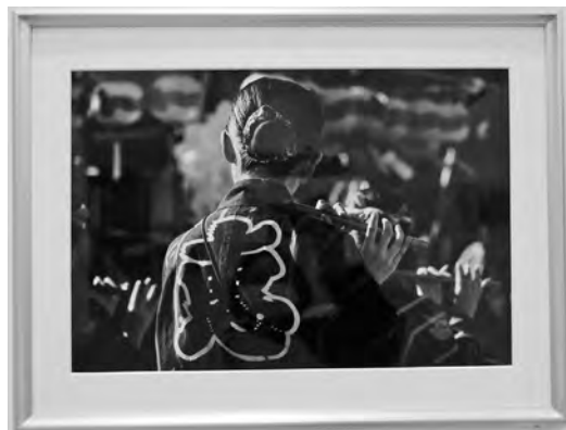
「祭りの音」