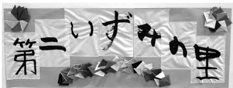
〈書道〉第二いずみの里書道クラブ「第二いずみの里」